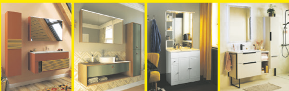
Archi Havana Atrato Urban

-15%* SUR UNE SÉLECTION DE MEUBLES DE SALLE DE BAINS**